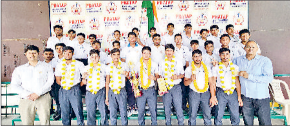
खरखौदा। खिलाड़ियों को सम्मानित करते हुए स्कूल प्रबंधन।