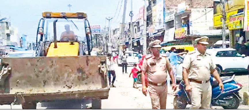
सोनीपत। अतिक्रमण हटवाने के लिए मशीन लेकर पहुंचे पुलिस कर्मी।

सावन माह में सड़कों पर जाम न लगे। उसके लिए यातायात को सड़क मार्ग से अतिक्रमण व अवैध पार्किंग को हटवाने के लिए पुलिस को कड़ी मशकत करनी पड़ रही है। बहालगढ़ चौक पर पुलिस गत दिनों में कई बार अभियान चला चुकी है, लेकिन लोग फिर से अतिक्रमण करने से बाज नहीं आ रहे हैं। एक महीने के अंदर यह तीसरी अतिक्रमण हटवाने की कार्रवाई है। अब दोबारा से अतिक्रमण करने वालों के खिलाफ कानूनी कार्रवाई की चेतावनी भी दी है। बता दें कि जीटी रोड बहालगढ़