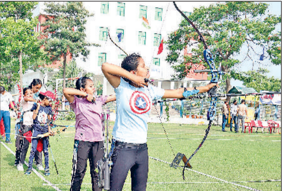
सोनीपत। पूर्ण मूर्ति ग्लोबल स्कूल में सीबीएसई नॉर्थ जोन-2 तीरंदाजी चैंपियनशिप के दौरान निशाना साधती तीरंदाजी