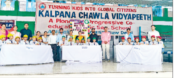
खरखौदा। गणित प्रश्नोत्तरी में भाग लेते विद्यार्थी।

वे नियमित रूप से पौधों की सिंचाई व संरक्षण करेंगे। इस अवसर पर सोसायटी के वरिष्ठ नागरिकों, युवाओं और बच्चों ने भी उत्साहपूर्वक भागीदारी की। कार्यक्रम को सफल बनाने में सोसायटी के प्रबंधन, स्वयंसेवकों व बच्चों की अहम भूमिका रही।