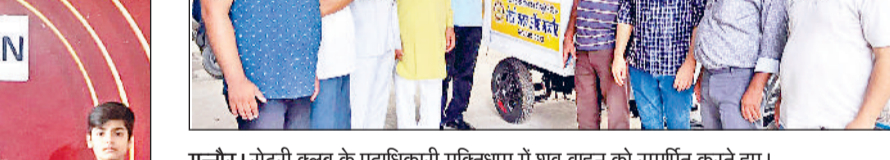
गन्नौर। रोटरी क्लब के पदाधिकारी मुक्तिधाम में शव वाहन को समर्पित करते हुए।