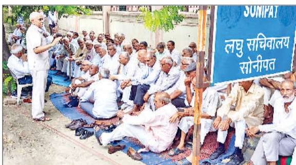
लघु सचिवालय के बाहर विरोध जताते रिटायर कर्मचारी संघ के पदाधिकारी।

धरने में वक्ताओं ने बताया कि पहले से ही पेंशनर्स की कई सुविधाएं समाप्त की जा चुकी हैं, जैसे कैशलेस मेडिकल सुविधा, रेलवे और हवाई यात्रा में किराए की छूट, बिजली बिल में राहत, और इनकम टैक्स से छूट। इसके विरोध में आज सुबह 10 बजे से दोपहर 2 बजे तक धरना दिया गया और