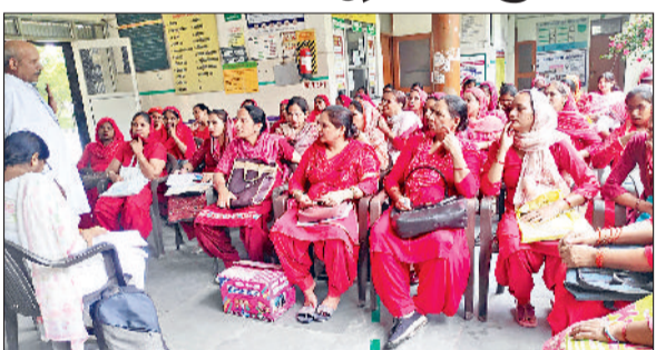
सोनीपत। बैठक करती हुई आशा वर्कर।

उन्होंने बताया कि आशा वर्करों को 6100 रुपये मासिक मानदेय मिलता है, जिसमें केंद्र और राज्य सरकार दोनों का हिस्सा होता है, लेकिन बीते सात महीनों से यह मानदेय नहीं मिल रहा है। इस कारण कई आशा वर्कर परिवारों के साथ आर्थिक तंगी और भ्रूखमरी की स्थिति का सामना कर रही हैं। बच्चों