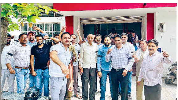
सोनीपत। डाकघर में अपनी मांगों को लेकर रोष जताते डाक कर्मचारी।