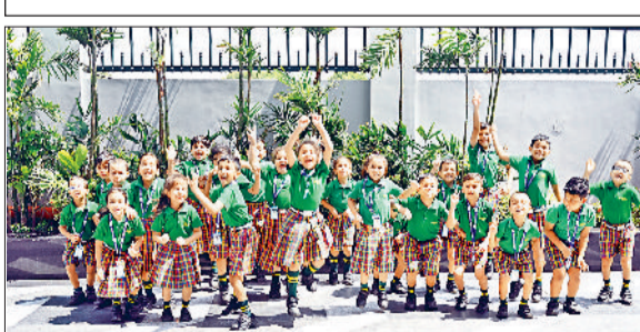
सोनीपत। आइसक्रीम पार्लर में पहुंचे विद्यार्थी।