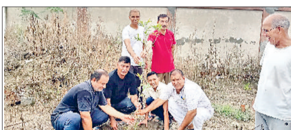
सोनीपत। श्रीराम रेजिडेंसी में पौधारोपण करते स्थानीय निवासी एवं अन्य।